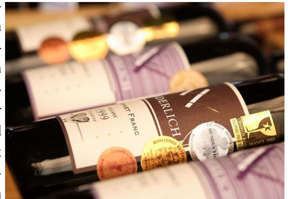
Weinkellerei Wunderlich in Villany

Hätte mich vor zwei bis drei Jahren jemand auf Ungarn angesprochen — mir wäre wohl zu Letzt die Assoziation mit exquisiten Weinen und Gaumenfreuden gekommen und vielleicht geht es Ihnen genau so. Die qualitativ ansprechenden Tokaj-Süss- & Weissweine mal ausgenommen haben die unsäglichen Balaton-Massenprodukte der kommunistischen Zeit das Image der Weinbaukultur Ungarns im Ausland stark negativ geprägt! Doch dies ist Schnee von Gestern. Dank einer beispiellosen Qualitätsoffensive hat sich in Ungarn in den letzten Jahren eine tolle Vinikultur-Szene mit einer ansehnlichen Anzahl qualitativ herausragender Produzenten und teilweise phantastischen Weinen ausgebildet. Dank vorteilhafter klimatischer und geologischer Voraussetzungen gedeihen heute in Ungarn in 22 Weinbaugebieten sowohl ausgezeichnete Weissweine wie auch hervorragende Rotweine, aber auch Rose- und Schaumweine von hoher Qualität.