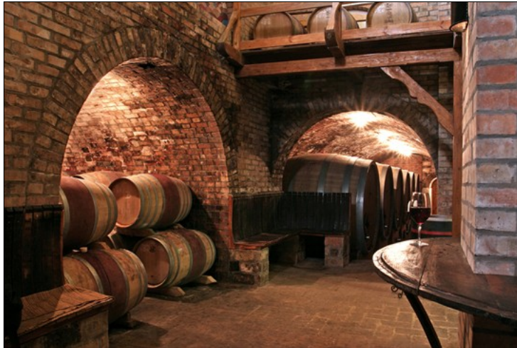
Weinkellerei Tiffan's in Villany

Der Verein bezweckt generell die Förderung und Bekanntmachung der Ungarischen Weinkultur in der